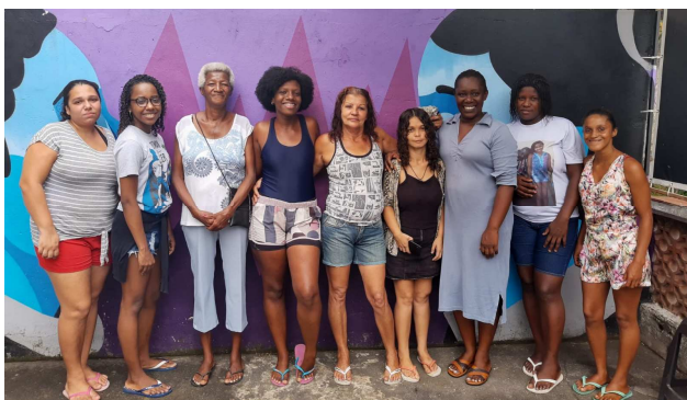
Des mères bénéficiaires du projet Café com Cultura

Grâce à cet investissement, Terr'Ativa réalise un objectif de longue date d'élargissement de son soutien au cadre familial , pré-requis essentiel à la réussite éducative des enfants de la communauté.